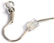
Detalle pieza - Piece detail Détail pièce