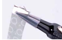
Detalle pieza - Piece detail Détail pièce