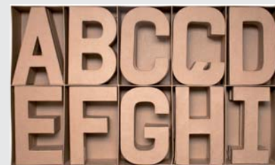
70250 Set 30 letras surtidas A-I 3u. x modelo