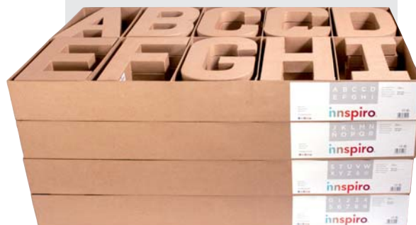
70255 Set 120 letras, números y símbolos surtidos 4 cajas (70250 + 70251 + 70252 + 70253)