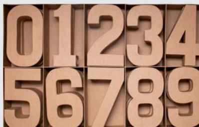
70253 Set 30 números surtidos 0-9 3u. x modelo