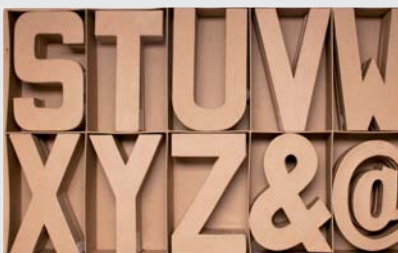
70252 Set 30 letras surtidas S-Z-&-@ 3u. x modelo