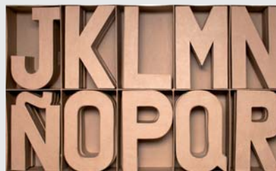
70251 Set 30 letras surtidas J-R 3u. x modelo