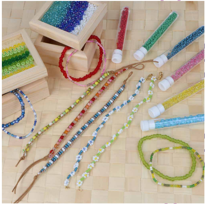
KIT ROCALLA VIDRIO GLASS BEADS KIT KIT ROCAILLE EN VERRE